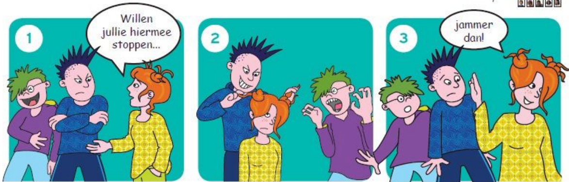
1 Zeg er iets van.