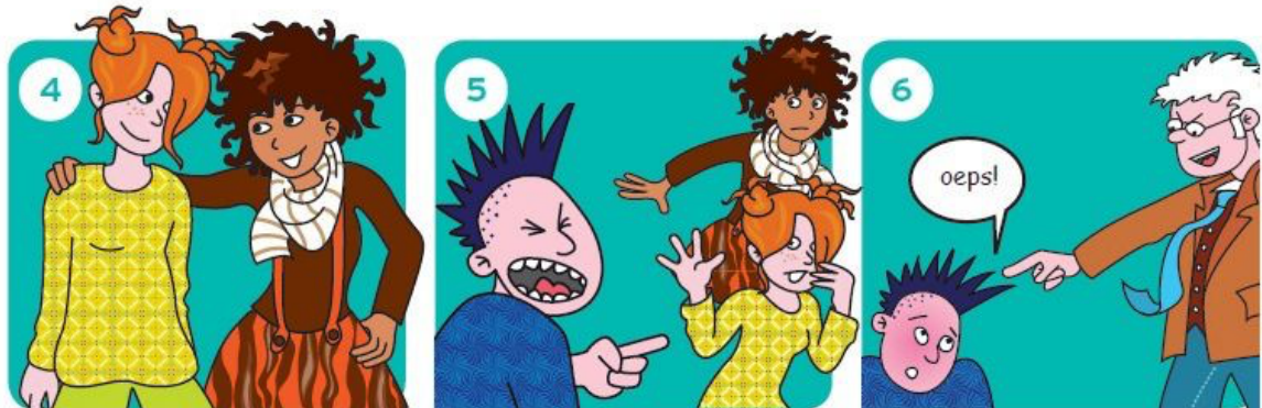
4 Stap naar je maatje of jouw maatje stapt naar jou.